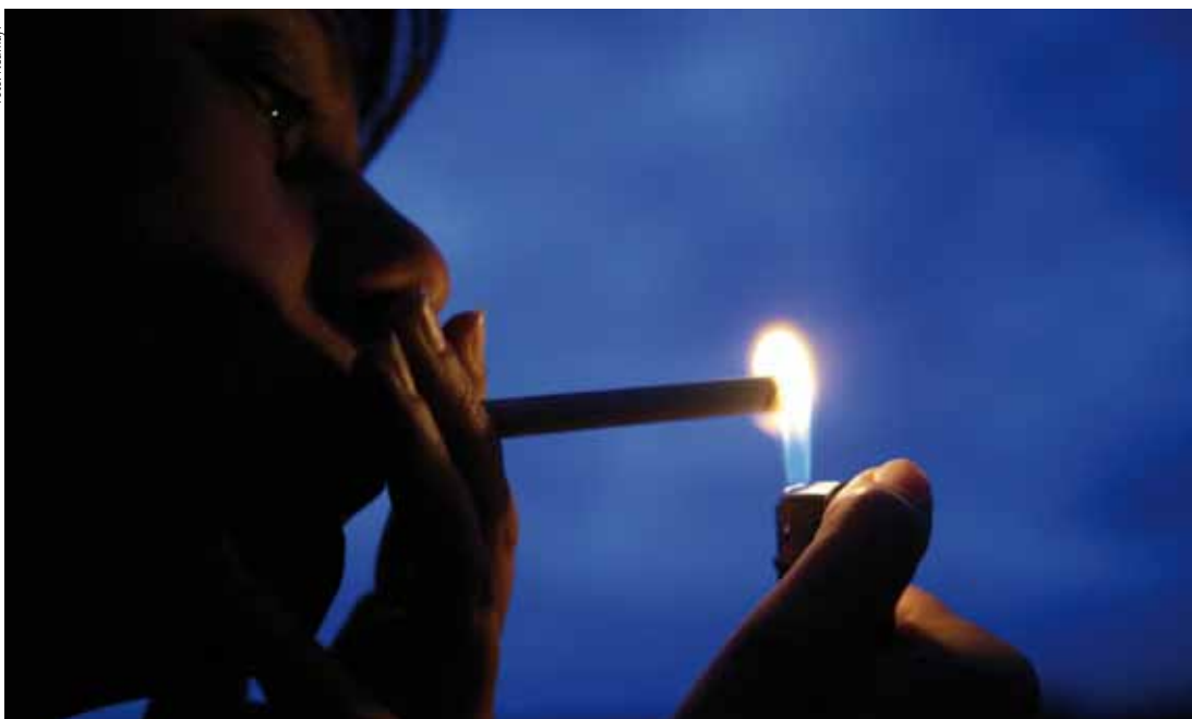
RAUCHER UND NICHTRAUCHERBEREICH: Gute Entlüftung genügt nicht.

Neue Entscheidungen • des Verwaltungsgerichtshofes