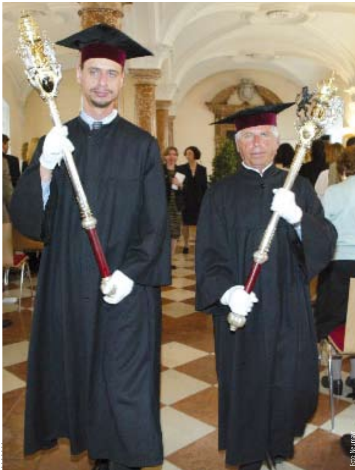
WER ZAHLT, wenn sich der Studienabschluss verzögert?

Auch im Fall von nicht in Abschnitte gegliederten Studi-